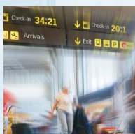
Trasporti e centri logistici, terminals e stazioni di servizio