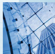
Centri servizi e sedi aziendali con servizio di pulizia dei bagni condivisi