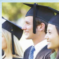
Scuole, università e colleges