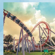
Centri Visitatori, parchi a tema, attrazioni turistiche